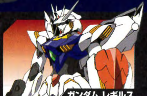
ガンダム レギルス

地球圏では無法者との悪名高い海賊ビシディアンだったが、その正体は連邦政府の腐敗に鉄槌を下そうとする義賊集団だった。