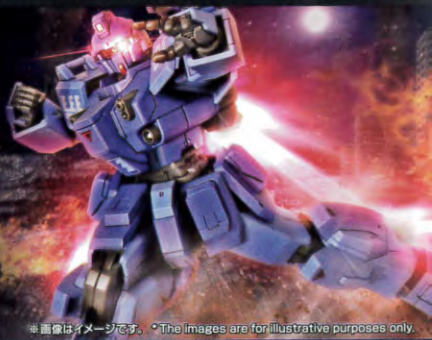
※画像はイメージです。*The images are for illustrative purposes only.